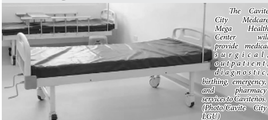
The Cavite City Medicare Mega Health Center will provide medical surgical, outpatient, diagnostic, birthing, emergency, and pharmacy services to Caviteños.