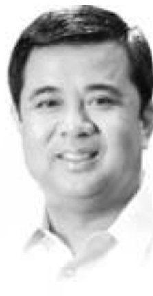
Mayor Alex "AA" Advincula Imus City, Cavite