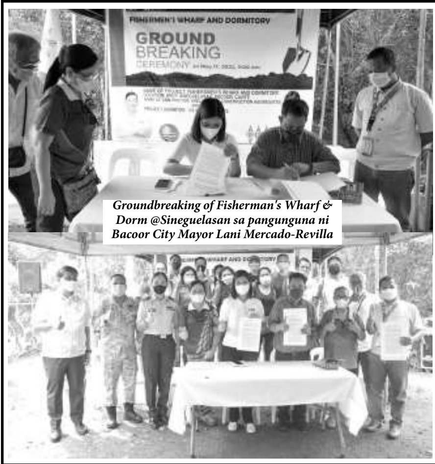
Groundbreaking of Fisherman's Wharf & Dorm @Sineguelasan sa pangunguna ni Bacoor City Mayor Lani Mercado-Revilla