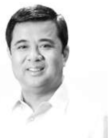
3rd District of Cavite