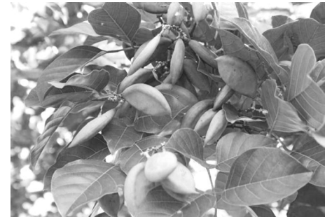
Scientific name: Pongamia pinnata Linn.; Pongamia glabra Linn.; Pongamia mitis Merr.

Ang bani ay isang mataas na puno, may malalapad at makinis na dahon, at may mababango at kulay lila o puti na bulaklak. Ang mga buto ay nasa loob ng matigas na balat. Karaniwang nakikitang nakatanim malapit sa mga dalampasigan, at sa probinsya ng Laguna na malapit sa lawa.