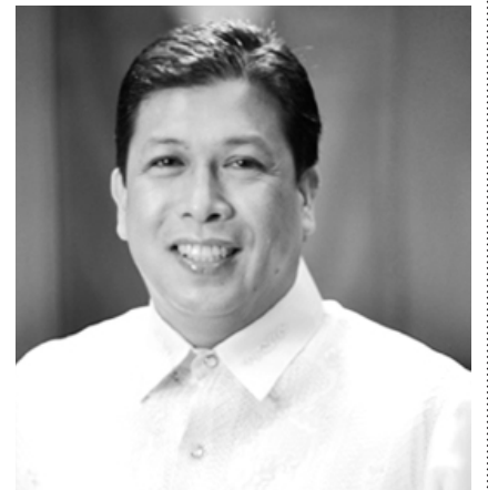
Vice Mayor Ony Cantimbuhan Imus City, Cavite