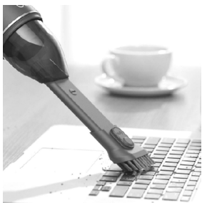
EufyHomeVac H11 is a mini vacuum that offers practical solutions in your home's cleaning needs.