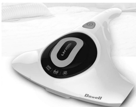
Dust off the mites from your bed with this Dowell UV Mites Cleaner.