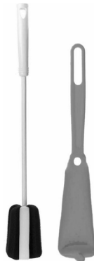
Kokubo Bottle Sponges for long bottle and glasses.