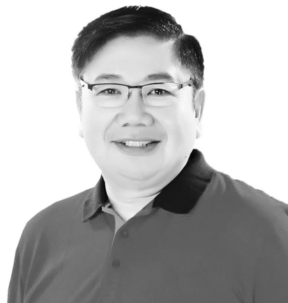
Mayor Ony Ferrer Gen. Trias, Cavite