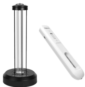
Sanitize and disinfect your home with this Landlite UV- C Sterilizer Portable Lamp and Pocket Stick.