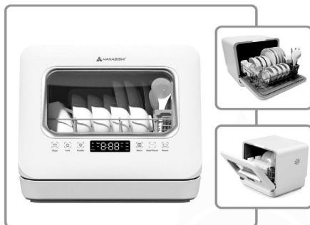
Save time from washing the dishes and keep your dinnerware germ-free with Hanabishi Dishwasher with UV Sterilizer.