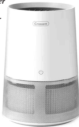
This Crossett Air Purifier is equipped with HEPA filter that ensures cleaner air for your home.