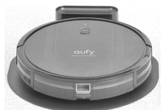
Let this EufyRoboVac G10 Hybrid take charge of mopping and sweeping in half the time as Mom relaxes