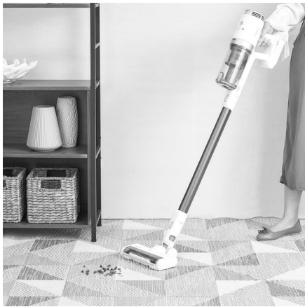
Clean with style with EufyHomeVac S11 Go, a cordless and lightweight stick-vacuum cleaner that allows you to maneuver into the corners and around furniture.